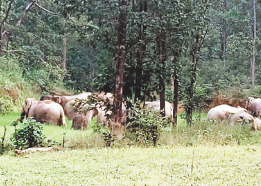
जंगल में हाथियों का दल।

नगर पंचायत प्रतापपुर क्षेत्र के सीमावर्ती गांव करंजवार जंगल में 30 हाथियों का दल आ जाने से क्षेत्र के ग्रामीणों में हड़कंप मच गया है। हाथियों के दल में नर मादा सहित शावक हाथी भी शामिल है। क्षेत्र लंबे समय से हाथियों के सक्रिय होने के बावजूद वन विभाग हाथी को भगा पाने में नाकाम है। हाथी ने सिर्फ खेतों में लगी फसल को नुकसान पहुंचा रहे है बल्कि लोगों के घरों को तोड़फोड़ कर क्षतिग्रस्त हो रहे है। 30 जंगली हाथी के आ जाने से जहां ग्रामीण अपने आप को असुरक्षित महसूस कर रहे हैं वहीं भय के साये में जीवन व्यतीत कर रहे हैं। गौरतलब है कि प्रतापपुर क्षेत्र से लगे ग्राम पंचायत करंजवार एवं सरहरी के जंगलों में हाथी लगातार एक हफ्ते से उत्पात मचा रहा है जहां दर्जनों किसानों के फसलों को नुकसान किया जा चुका है। अब फिर से 30