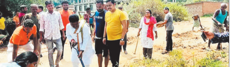
उपस्थिति में सड़क सुधार कर श्रमदान का कार्य किया है।