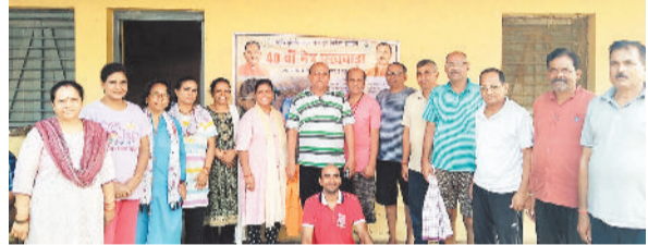
हरिभूमि न्यूज, मनेन्द्रगढ़